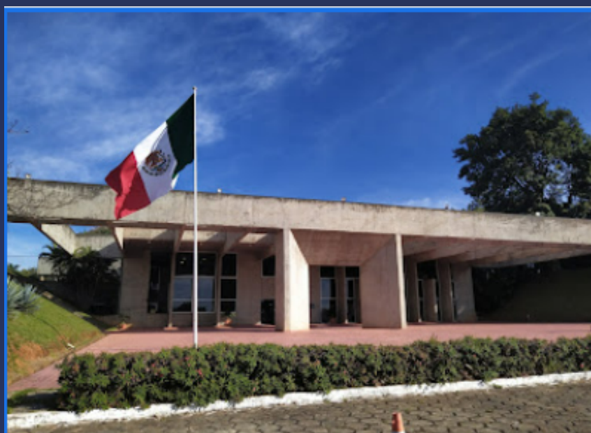
Embaixada do México – Mexican Embassy – Embajada de México

Site: https://consulmex.sre.gob.mx/riodejaneiro/index.php