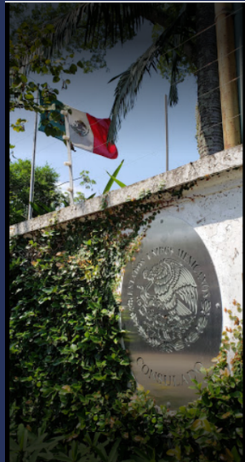
Consulado Geral do México em São Paulo Mexican Consulate General in São Paulo Consulado General de México en São Paulo

Website: https://consulmex.sre.gob.mx/riodejaneiro/index.php