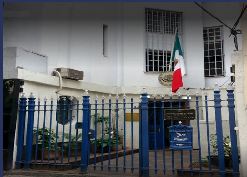
Consulado geral do México no Rio de Janeiro Mexican Consulate General in Rio de Janeiro Consulado General de México en Rio de Janeiro

Sitio: https://consulmex.sre.gob.mx/riodejaneiro/index.php