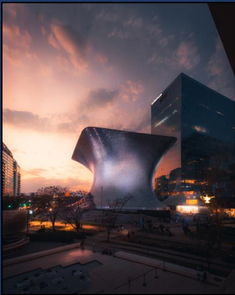
Museu Soumaya Soumaya Museum Museo Soumaya

Para os compradores que desejam uma experiência mais sofisticada, no bairro de Polanco estão diversas lojas de marcas mundialmente famosas, assim como linhas internacionais de restaurantes de alto nível. Suas ruas exibem mansões no estilo Colonial Revival espanhol e apartamentos de luxo. Ao norte, Nuevo Polanco apresenta uma arquitetura moderna, incluindo o futurista Museo Soumaya, com sua vasta coleção Rodin, além de um dos maiores aquários da América Latina.