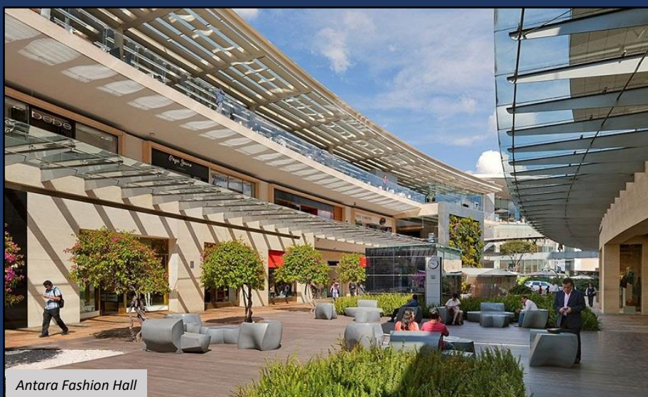
Antara Fashion Hall

Para los compradores que deseen una experiencia más sofisticada, el barrio de Polanco alberga varias tiendas de marcas de renombre mundial, así como líneas internacionales de restaurantes de alto nivel. Sus calles muestran mansiones de estilo colonial español y pisos de lujo. Al norte, Nuevo Polanco presenta una arquitectura moderna, incluido el futurista Museo Soumaya, con su amplia colección de Rodin, así como uno de los mayores acuarios de América Latina.